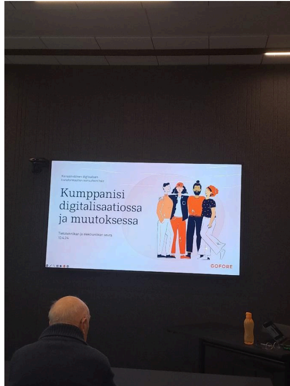
Goforen harrastutiloista ja luentosalista

Viimeisenä kohteena oli start-up -keskus Platform6, joka on saanut nimensä siitä että viereisellä rautatieasemalla on 5 laituria.